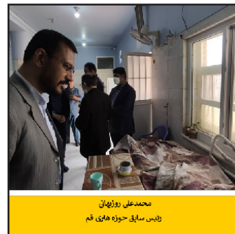
محمدعلی روزبهان رئیس ستاد سلامت و بهزیستی کشور