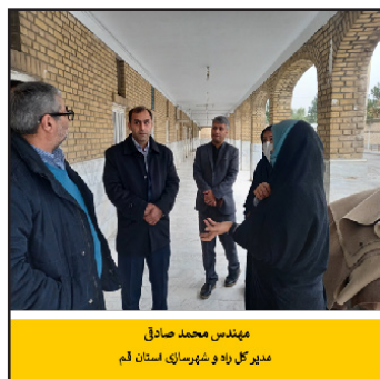
مهندس محمد صادقی مدیرکل راه و شهرسازی استان قم