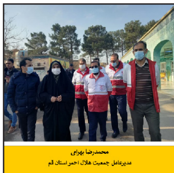
محمدرضا بهرامی مدیرعامل جمعیت هلال احمر استان قم