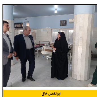
ابوالفضل خان رئیس ستاد سلامت و بهزیستی کشور