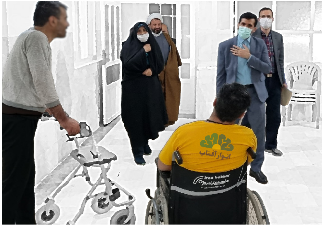
معاون وزیر و ریاست سازمان بهزیستی کشور در بازدید از آسایشگاه سالمندان و معلولین انوار آفتاب

گزارش عملکرد سال ۱۴۰۱ آسایشگاه سالمندان و معلولین