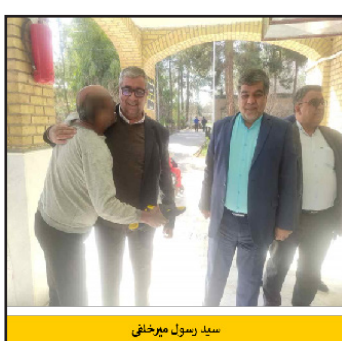
سید زین العابدین میرحاجی مدیرکل ورزش و جوانان استان قم